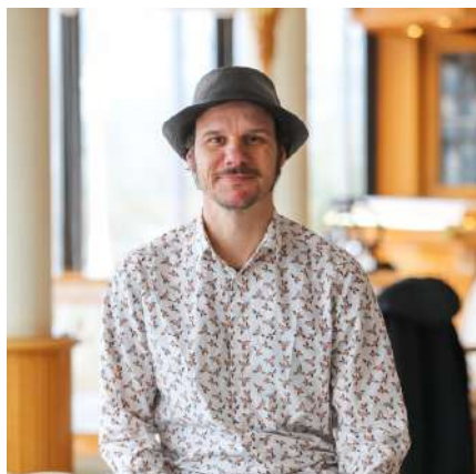
Crèdits: Martí Albesa