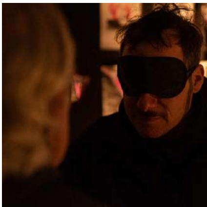
Crèdits: Dani Hernandez