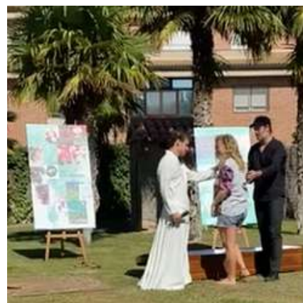
Crèdits: Queralt Guinot i Oriol Segon